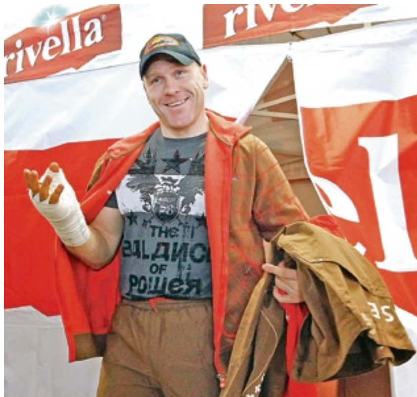
Vorhang auf für Didier Cuche: Die Anprobe der Olympia-Kleider macht ihm sichtlich Spass.

ROTHRIST. Olympia kann kommen: Das Schweizer Männer-Skiteam ist für Vancouver eingekleidet.